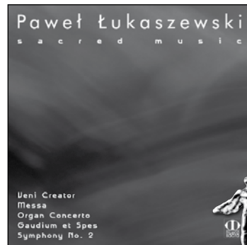
MSE 013 Frydryk