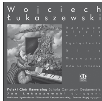
MSE 004 Frydryk nominacja

Libera me de morte aeterna. Libera me, Domine.