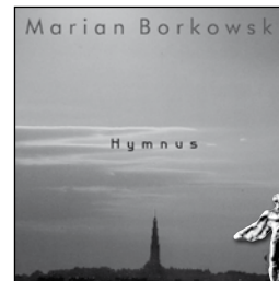
MSE 020 Nominacja