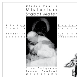
MSE 001 Fryderyk