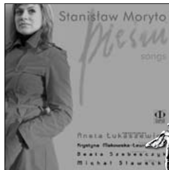
MSE 014 Fryderyk - nominacja